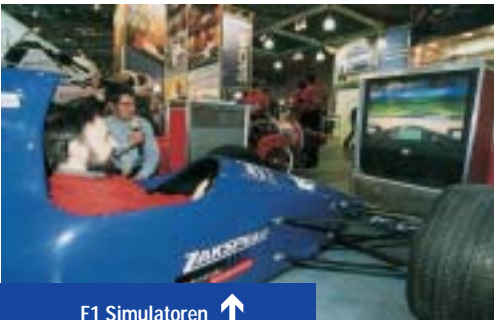
F1 Simulatoren ↑