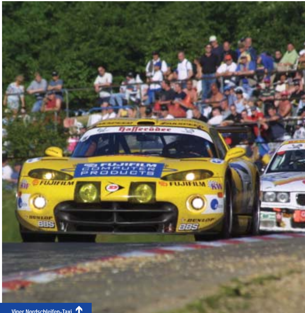
Viper Nordschleifen-Taxi ↑