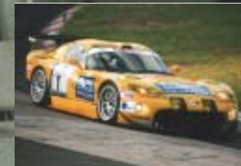
Unten: Die Gesamtsieger beim 24 h Rennen 2002 auf dem Nürburgring mit der Zakspeed Viper