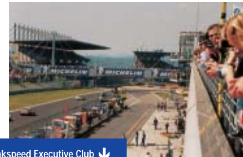
← Zakspeed Executive Club ↓