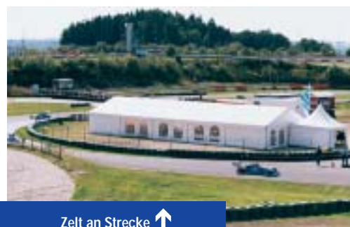
Zelt an Strecke ↑