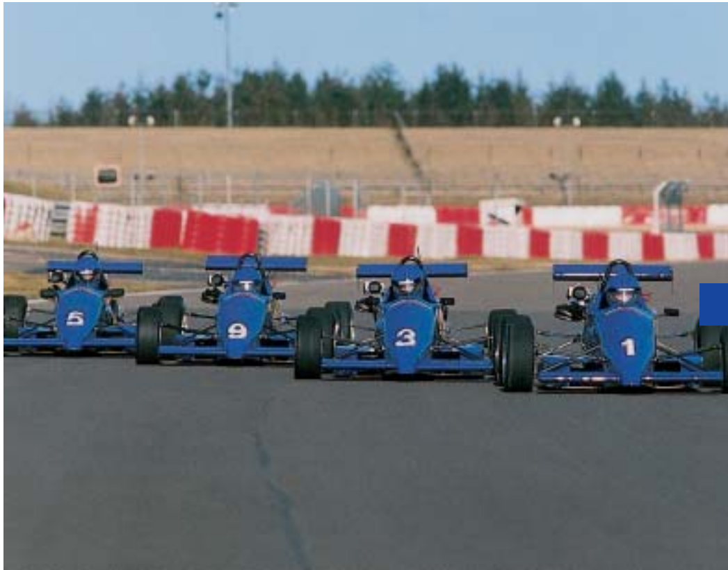
← Formel Training ↓