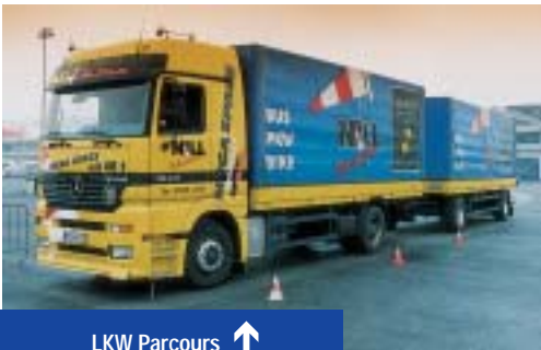
LKW Parcours ↑