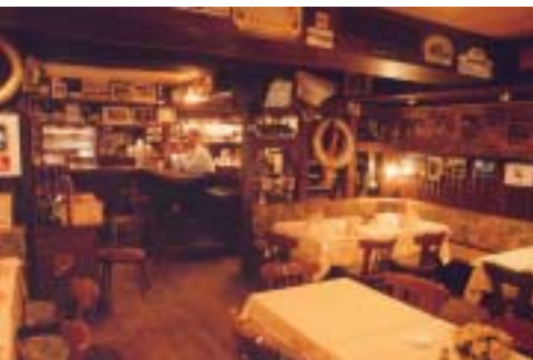
↓ Abendveranstaltungen ↑