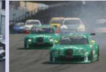
Zakspeed im Motorsport, von 1968 bis heute