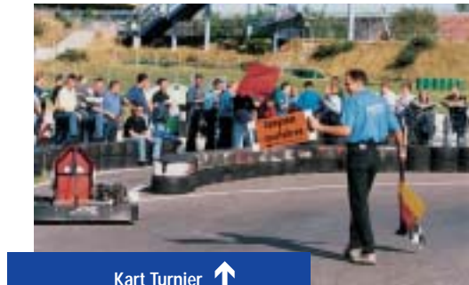
Kart Turnier ↑