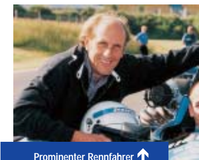
Prominenter Rennfahrer ↑