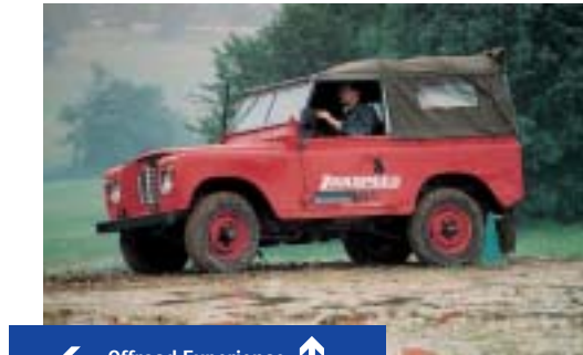
← Offroad Experience ↑